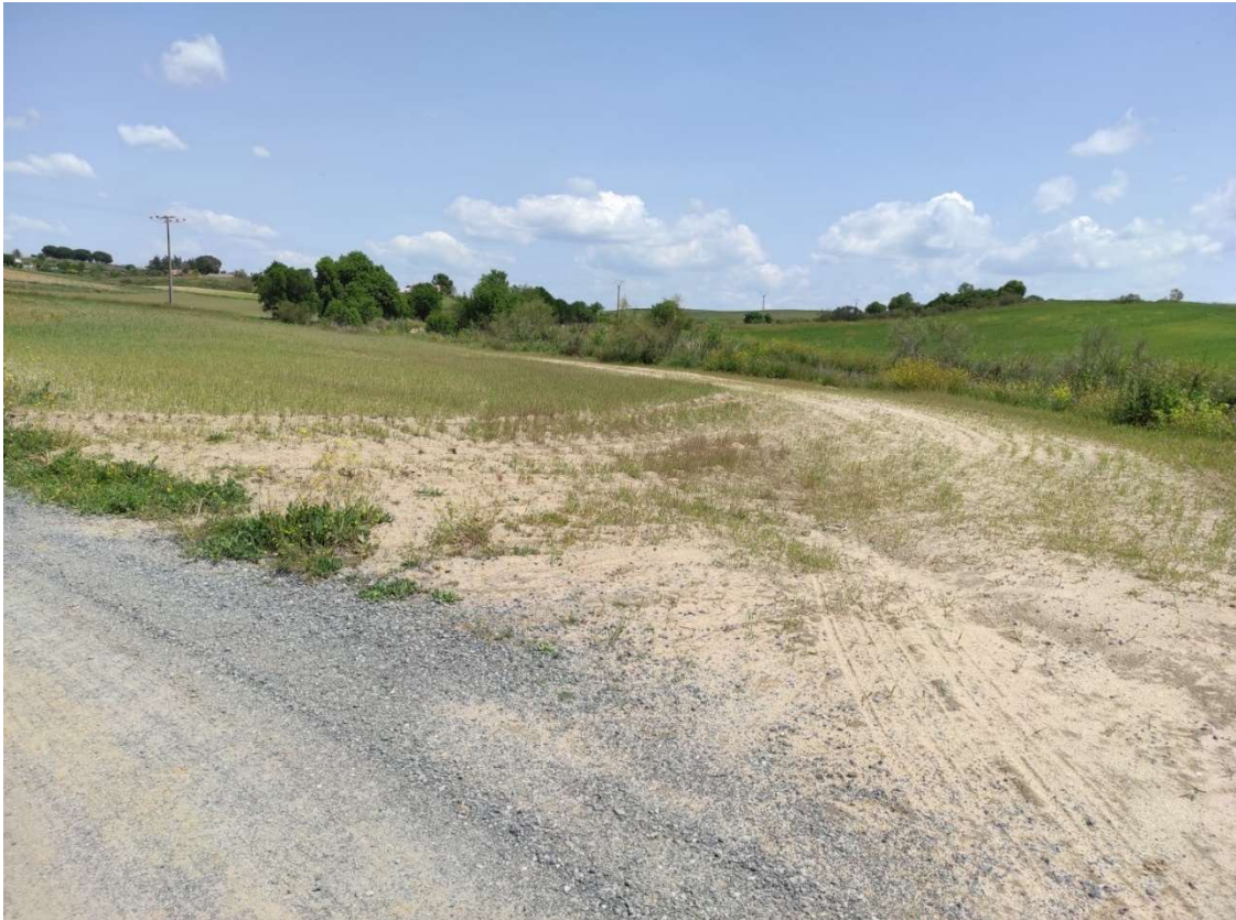
Acceso al apoyo T-110