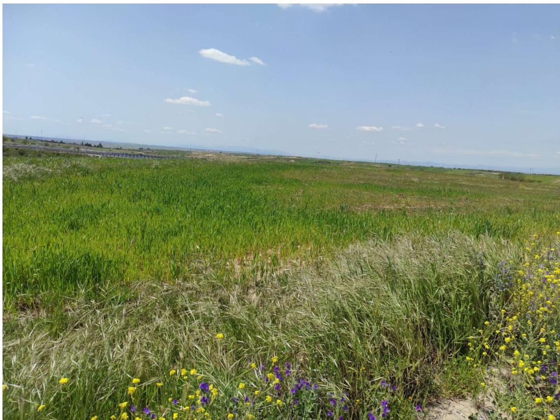
Ubicación del apoyo T-108