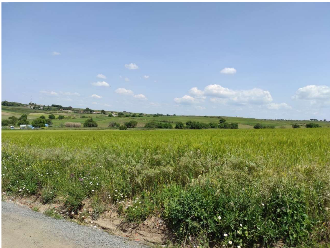
Ubicación del apoyo T-109