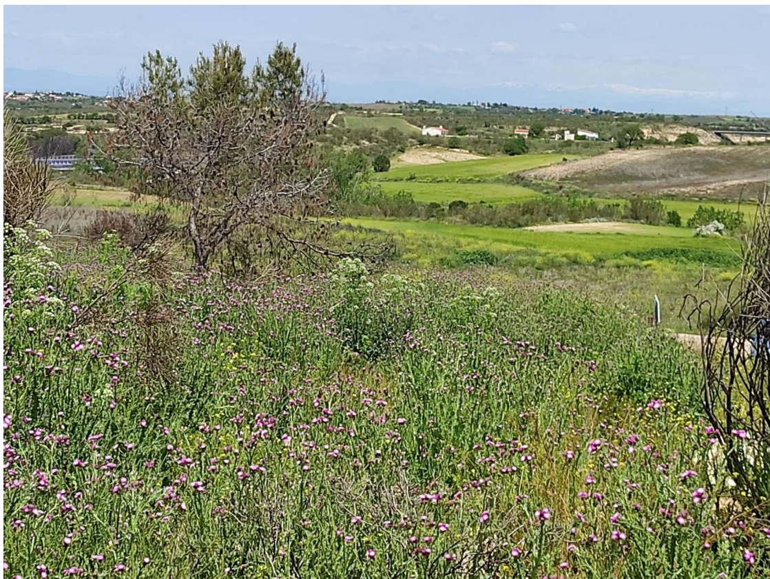
Trazado de la LAT hacia los apoyos T-098 y T-099, salvando el arroyo del Carcavón (en el centro de la fotografía).