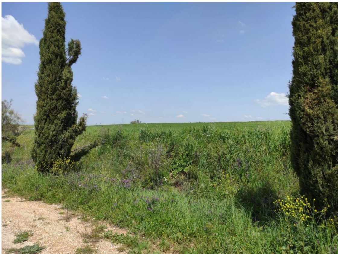
Detalle del talud de acceso que tendrá que superar el trazado soterrado en dirección al apoyo T-107PAS