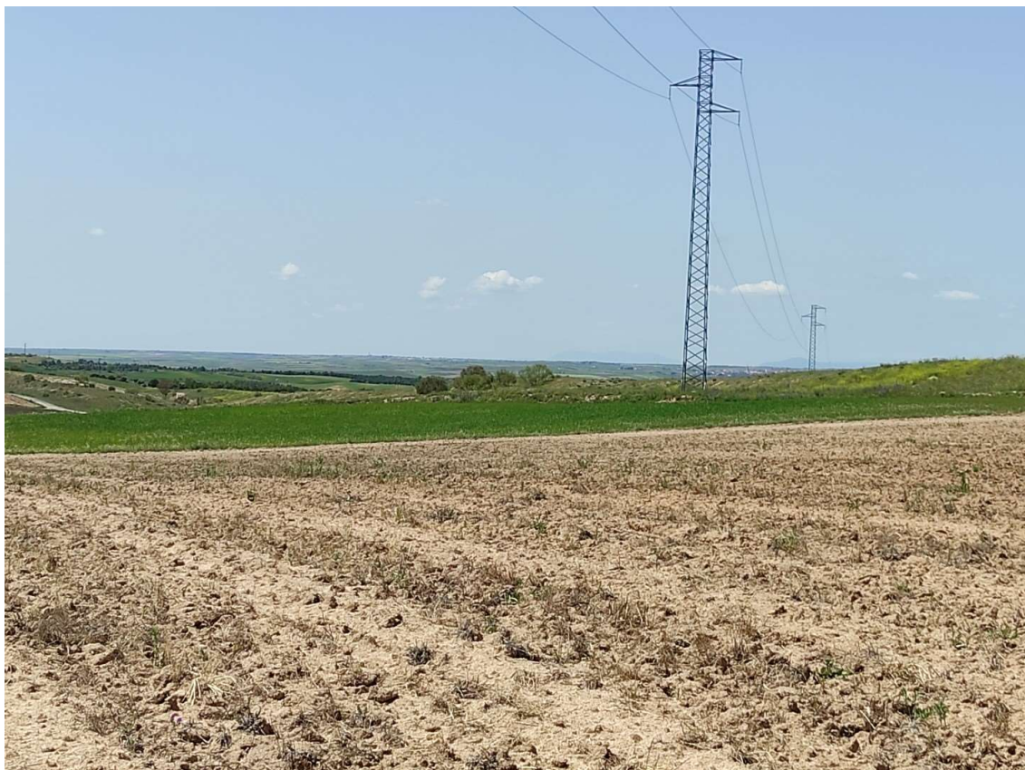
Parcela de ubicación del apoyo T-104