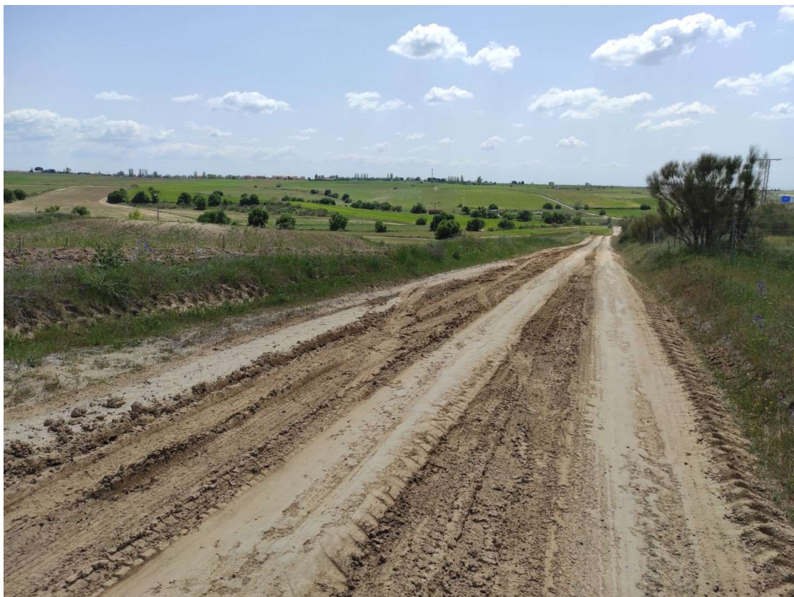
Camino de acceso al apoyo T-111