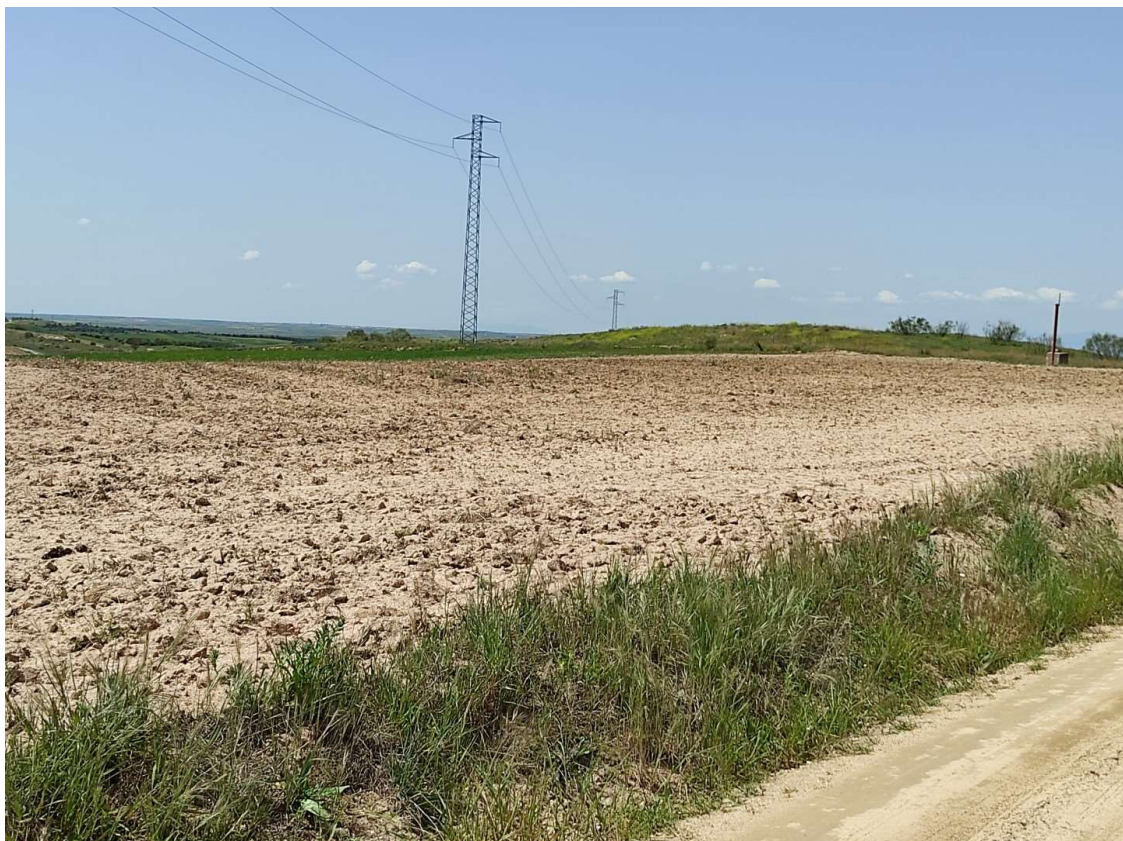
Acceso al apoyo T-104