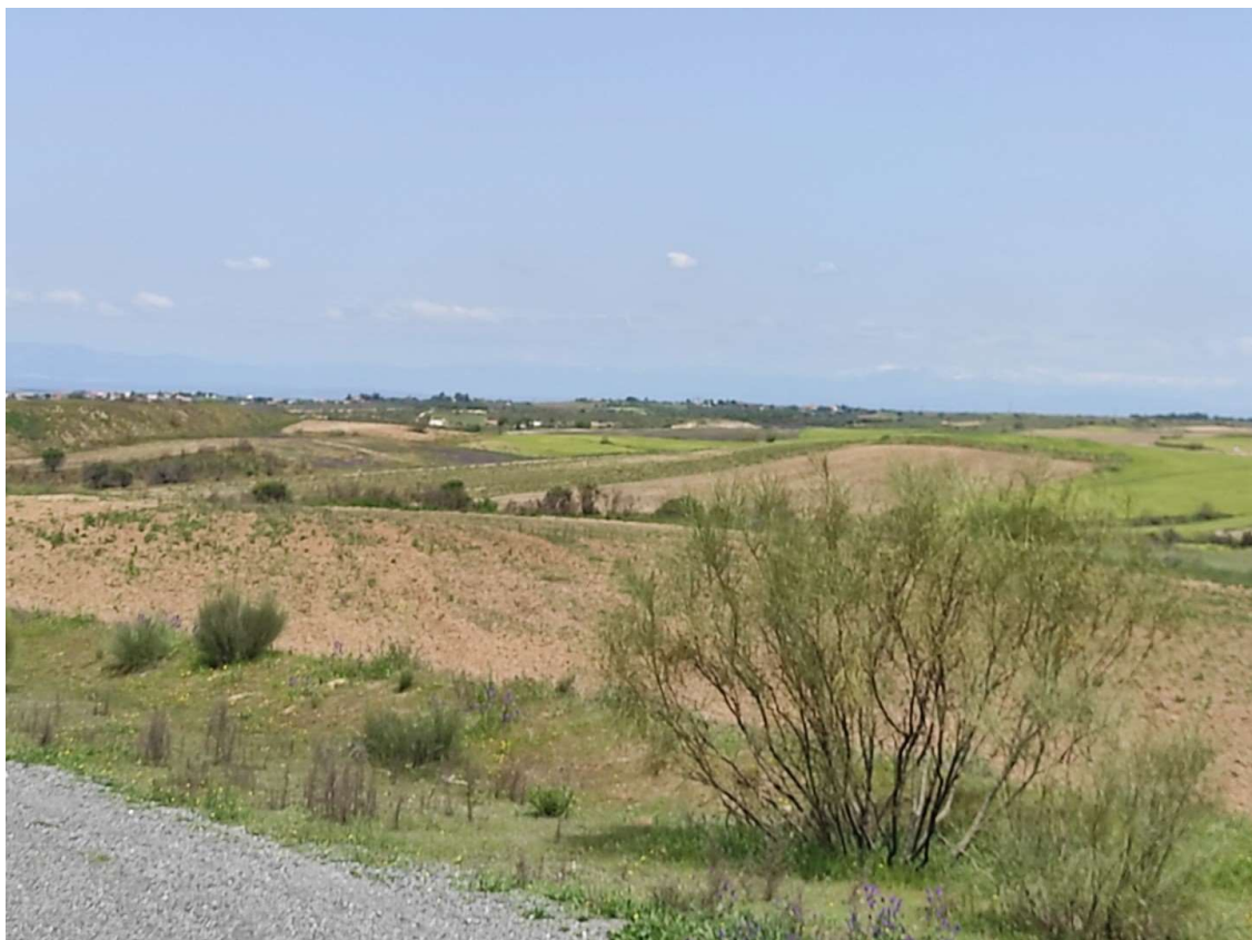
Trazado de la LAT desde el apoyo T-094 hacia el T-095