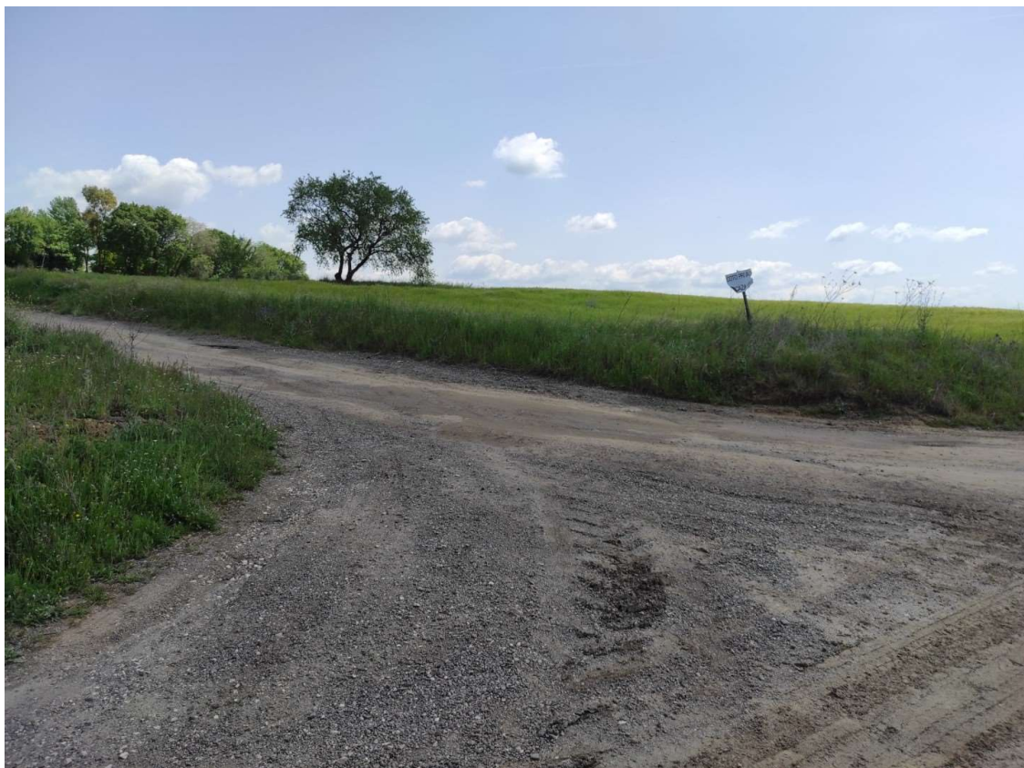
Camino de acceso al apoyo T-112