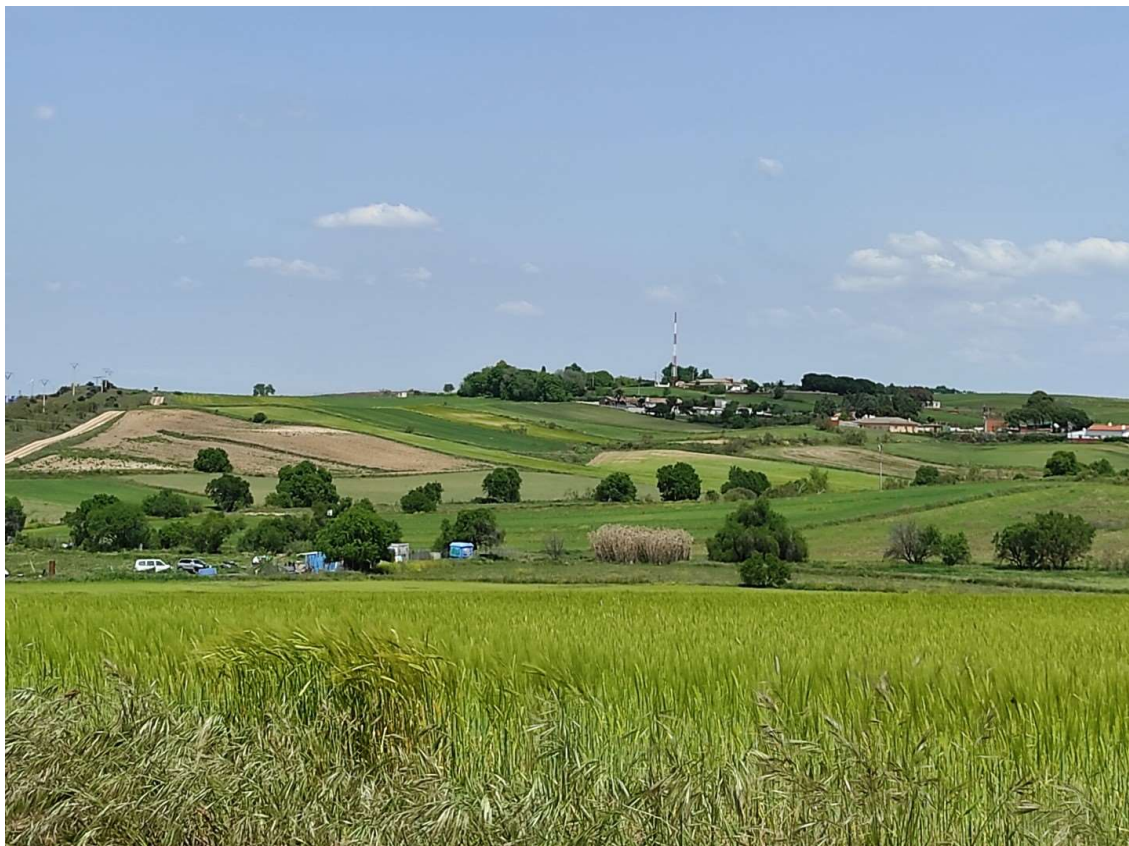
Detalla del trazado hacia los apoyos T-110 y T-111