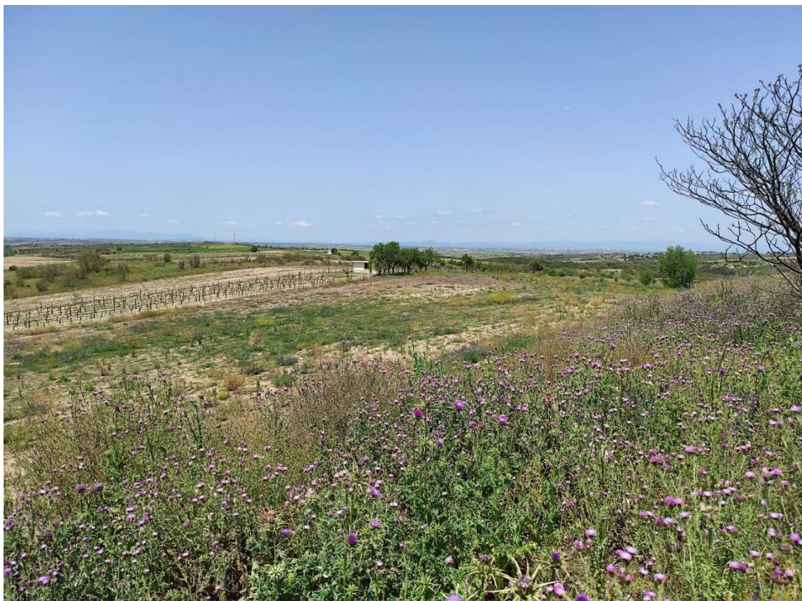
Parcela de ubicación del apoyo T-097