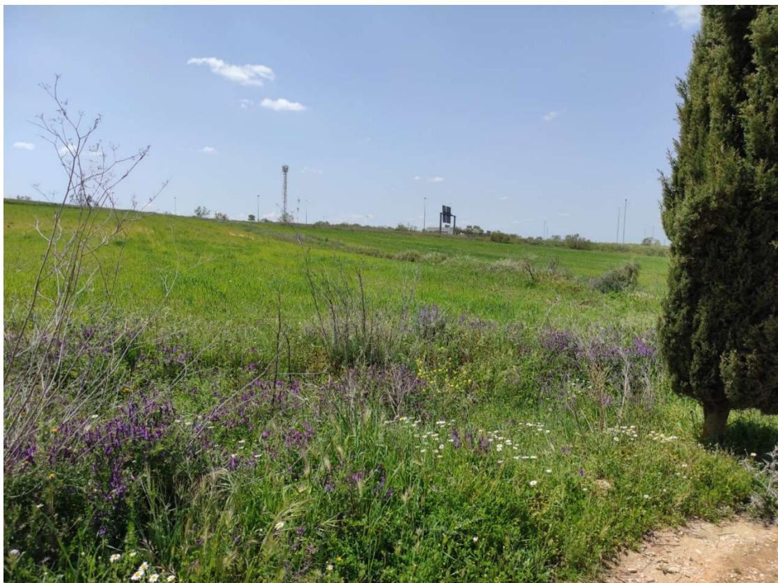
Detalle del trazado soterrado desde la AP-41 (al fondo) en dirección al apoyo T-107PAS