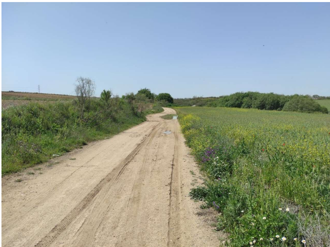
Camino de acceso al apoyo T-094 desde la urbanización Coto del Zagal de Carranque