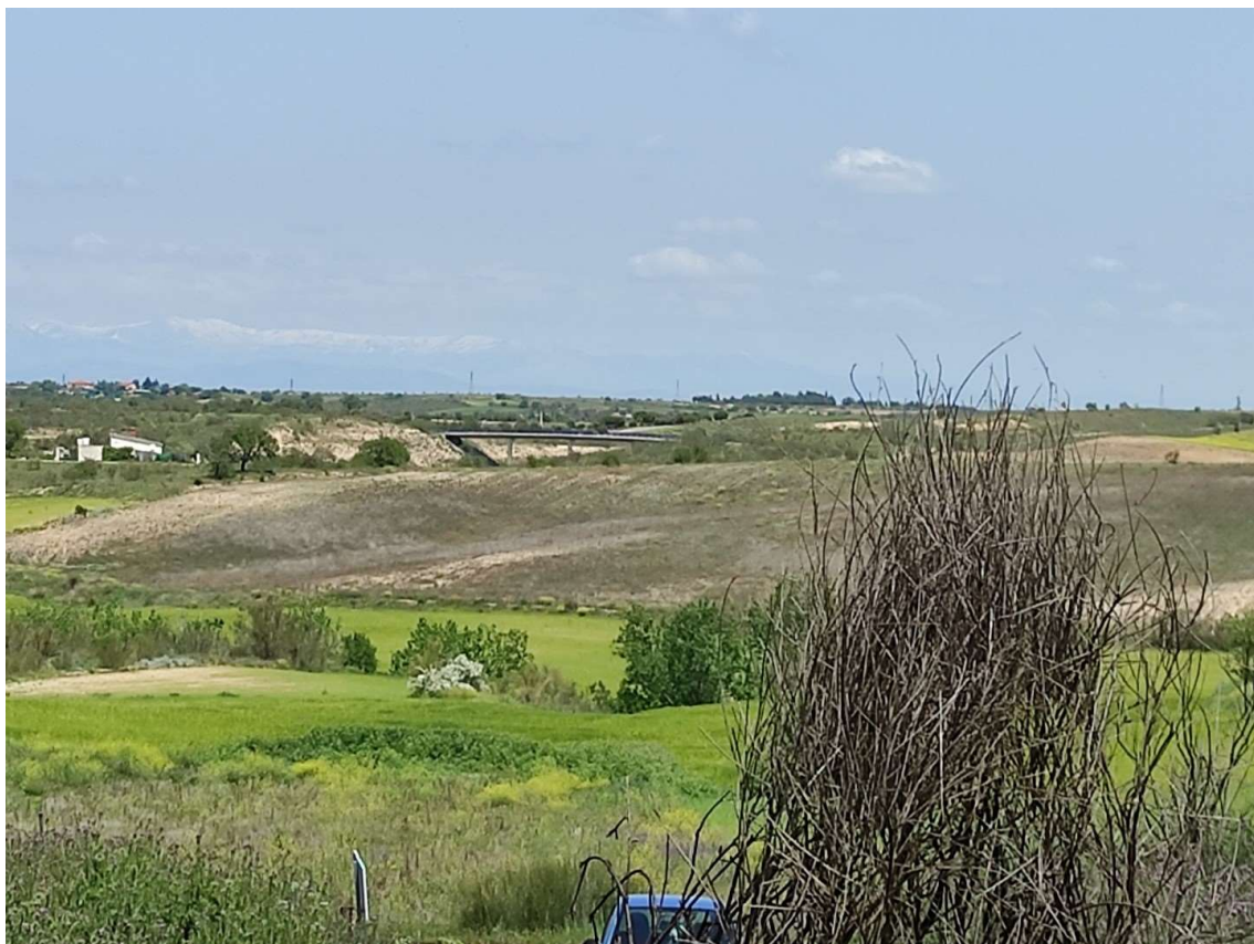
Detalle del trazado de la LAT hacia los apoyos T-098, T-099 y T-100