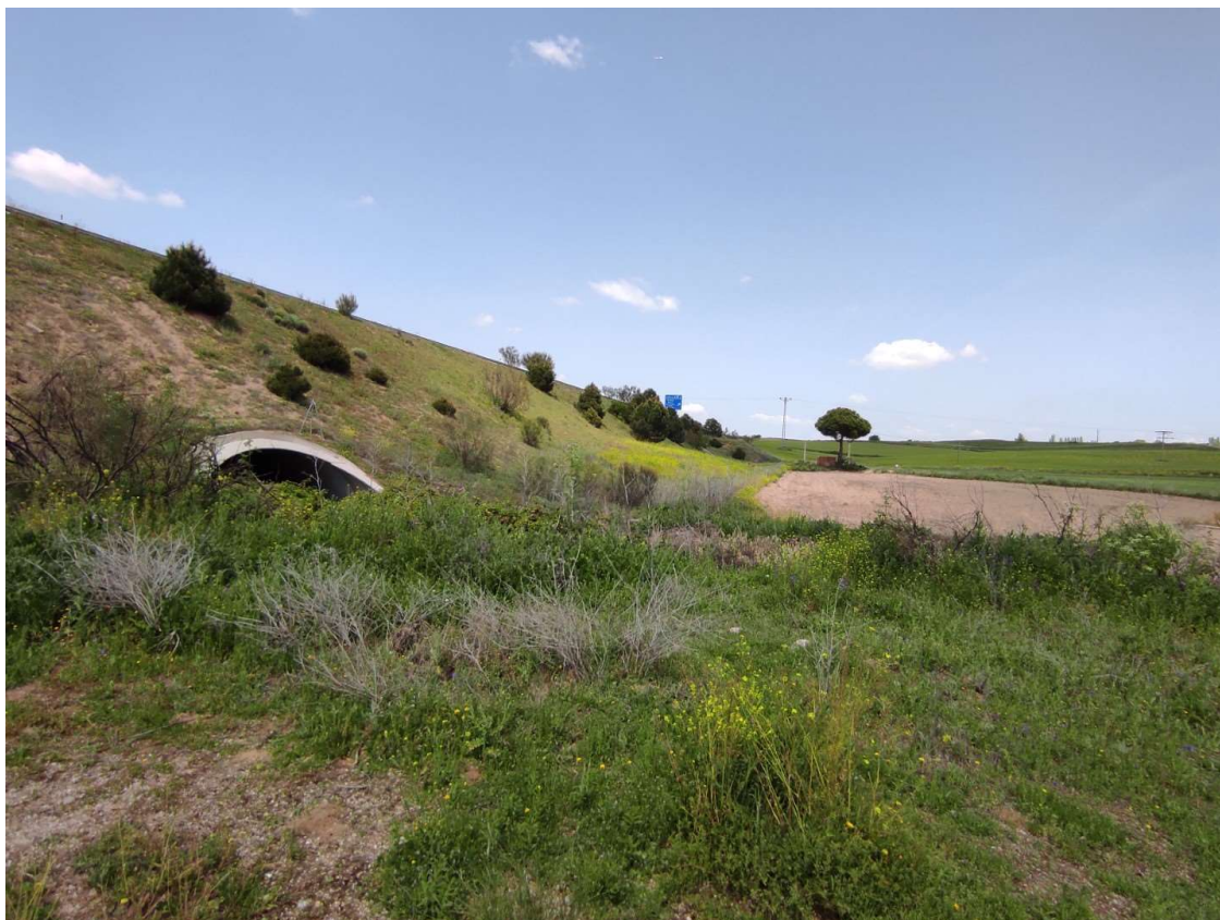
Trazado de la línea soterrada junto a la autovía AP-41