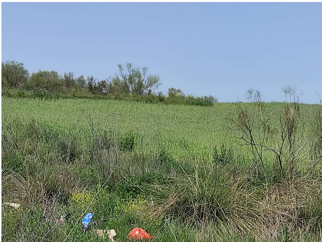
Parcela de ubicación del apoyo T-094