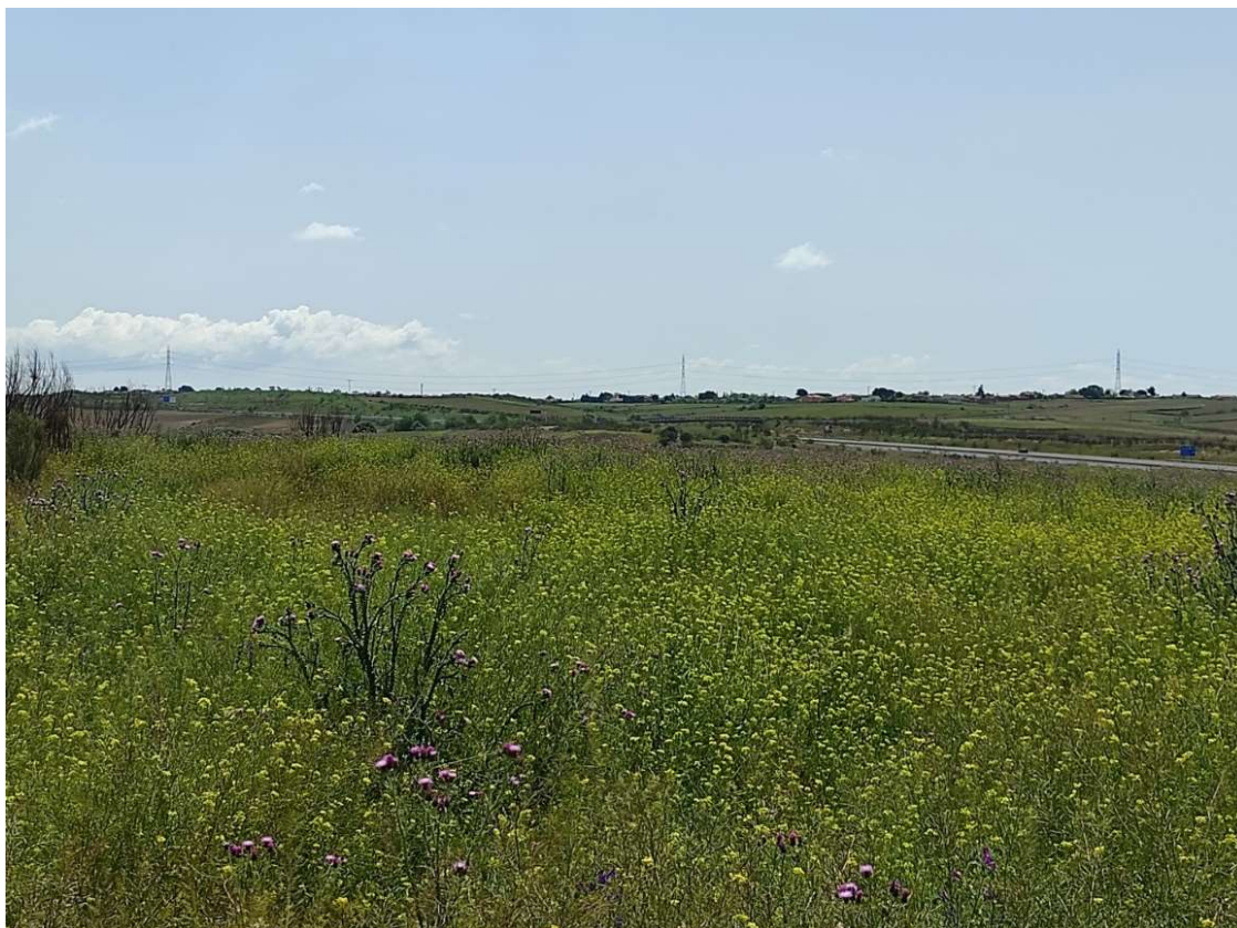
Vista de del trazado desde los apoyos T-094, T-095 y T-096