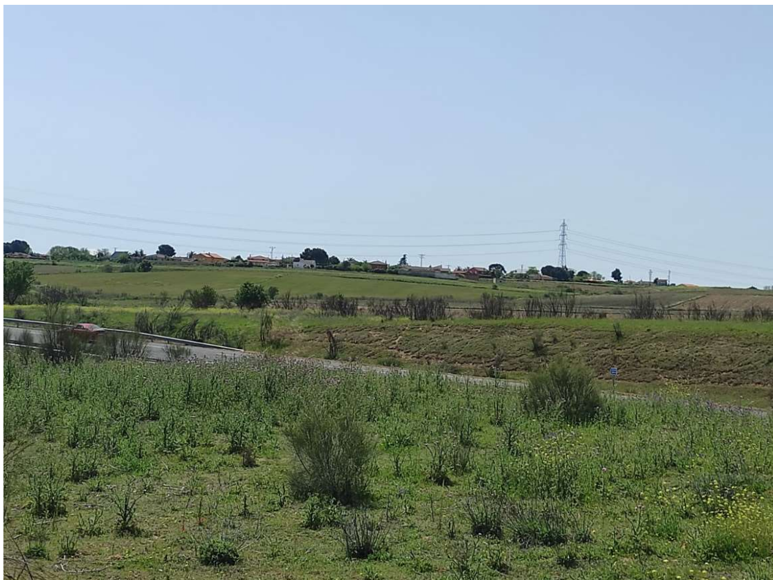
Trazado de la LAT desde el apoyo T-093 hacia el T-094