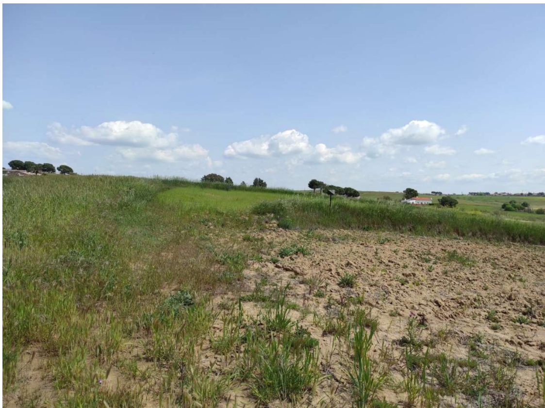
Ubicación del apoyo T-111.