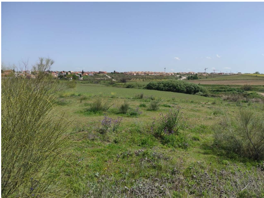
Parcela de ubicación del apoyo T-094, y al fondo la urb Coto del Zagal de Carranque