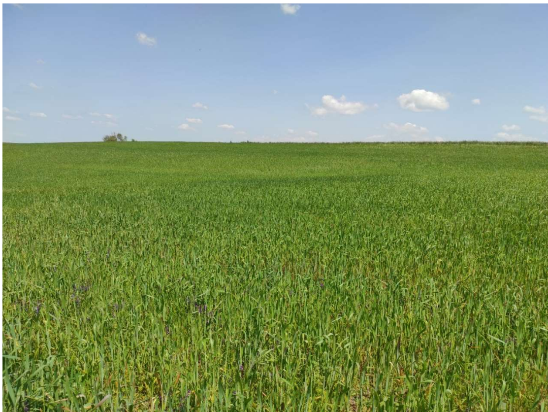
Ubicación del apoyo T-107PAS