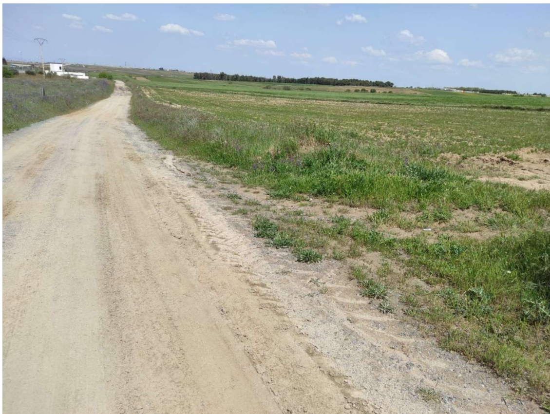
Camino de acceso al apoyo T-113