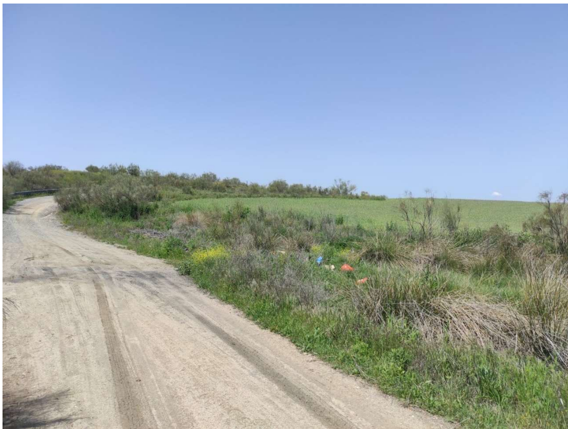
Acceso a la parcela del apoyo T-094