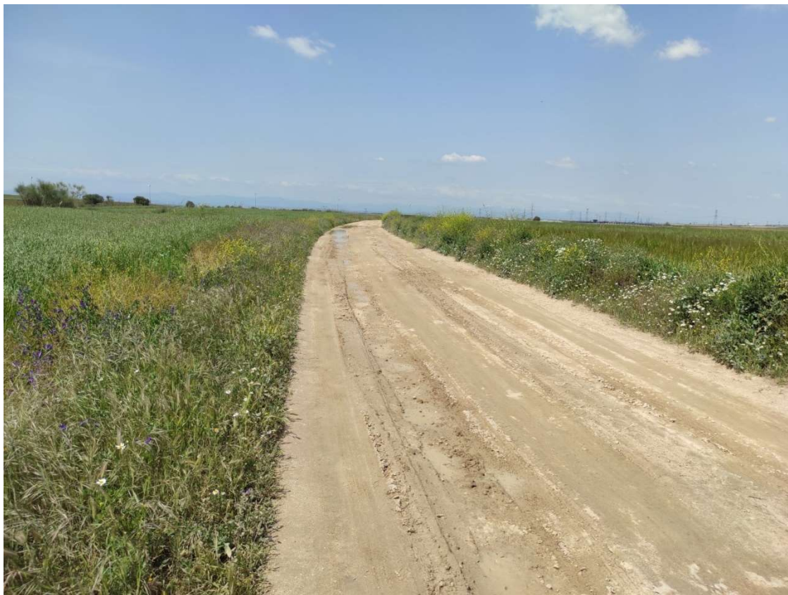
Camino por donde transcurrirá el último tramo soterrado de la LAT