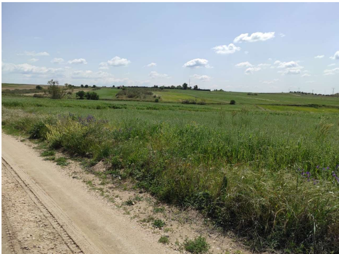
Ubicación del apoyo T-115PAS