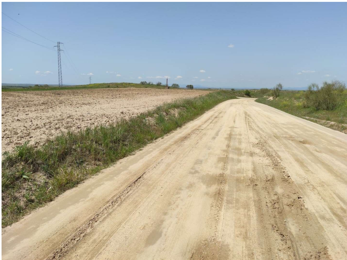
Camino de acceso al apoyo T-104