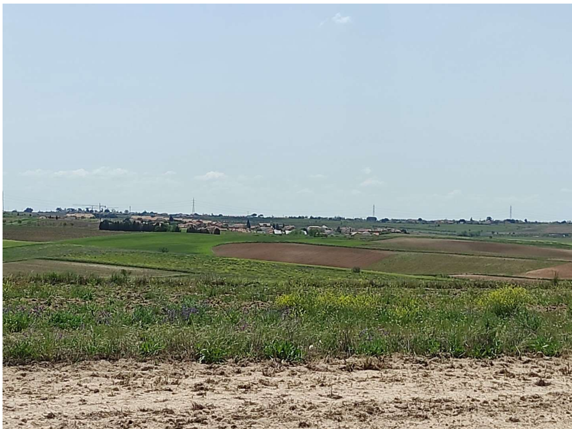
Detalle del trazado de la LAT desde los apoyos T-101, T-102 y T-103 hacia el T-104