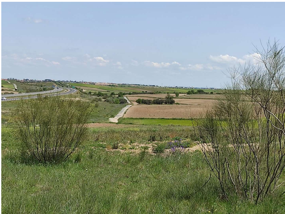
Detalle del trazado de la LAT desde el apoyo T-104 hacia el T-105 y T-106PAS de soterramiento