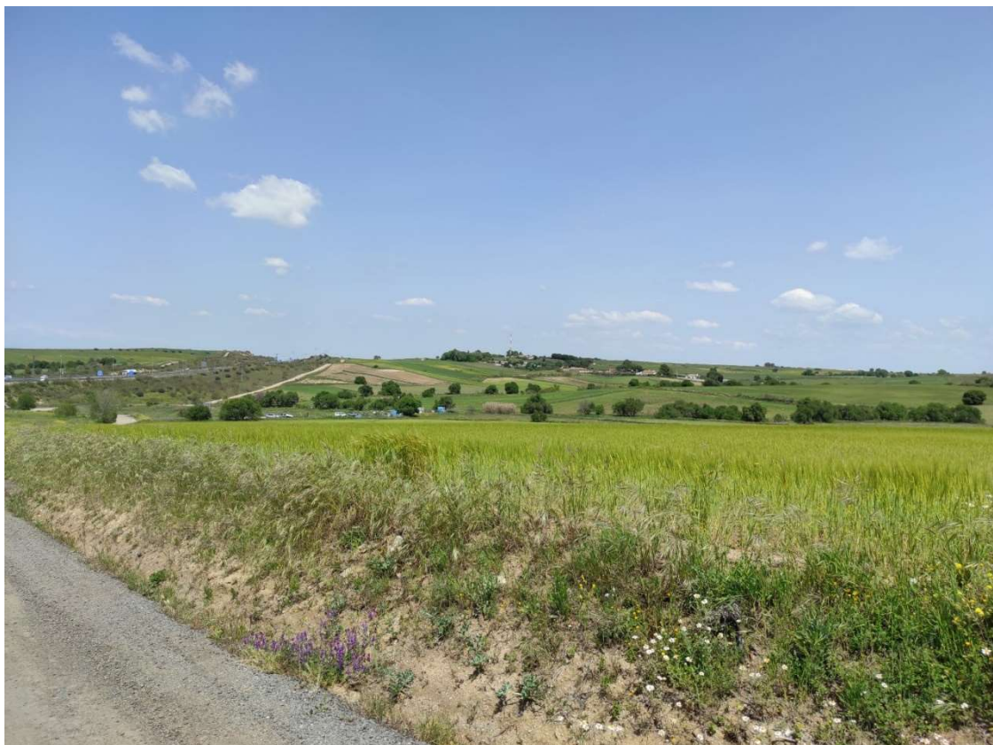
Acceso al apoyo T-109