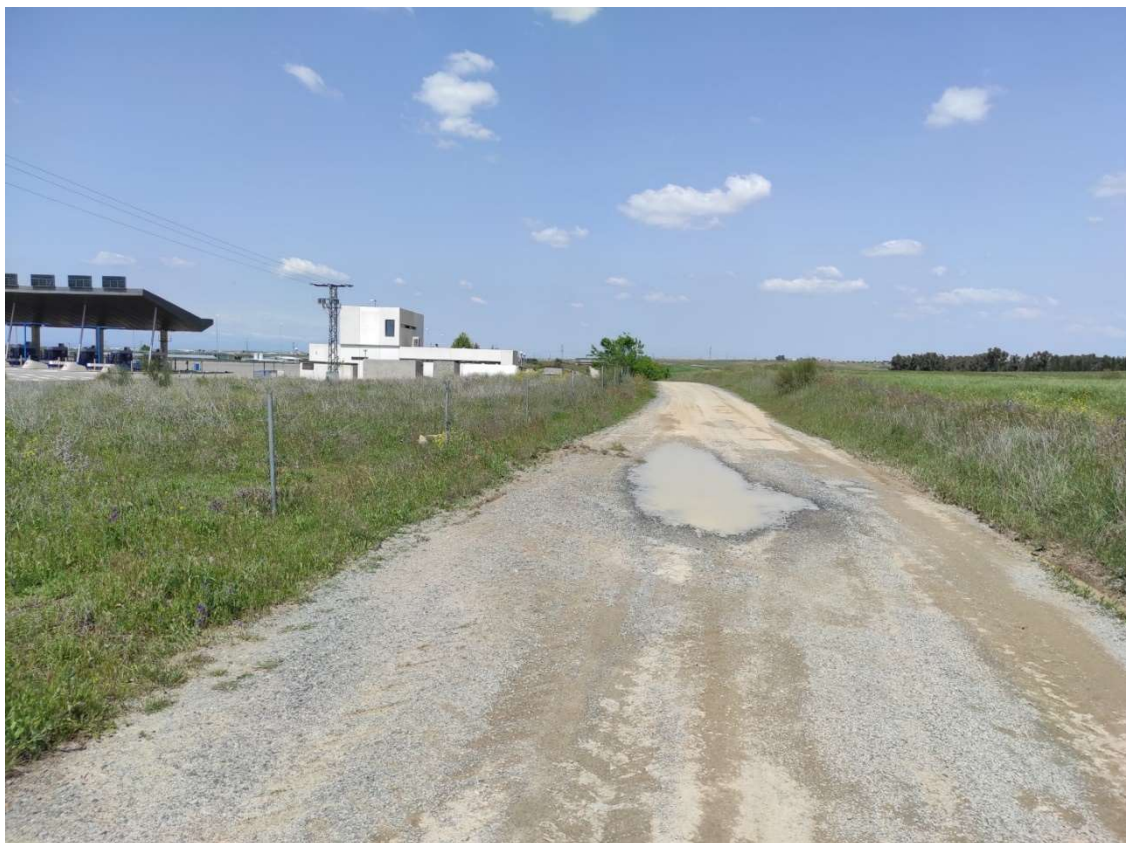
Camino de acceso al apoyo T-114