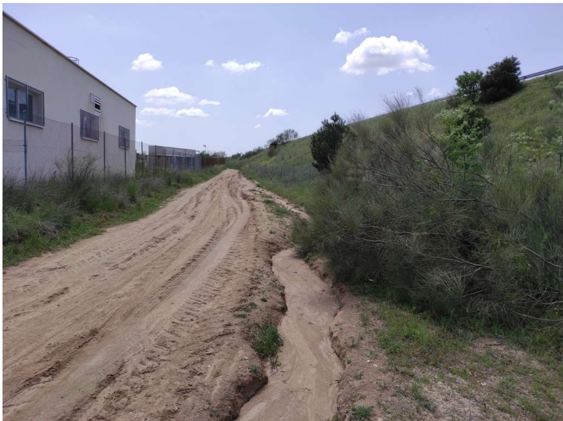
Camino junto a la EDAR de Serranillos del valle, por donde vendrá soterrada la LAT