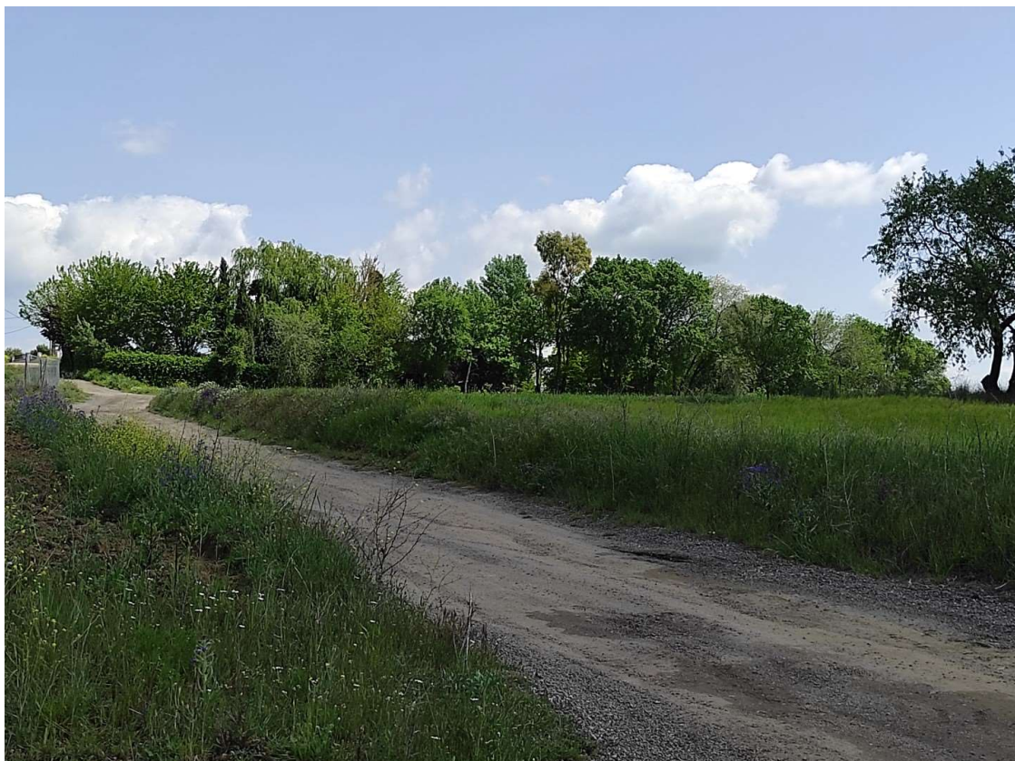
Ubicación del apoyo T-112