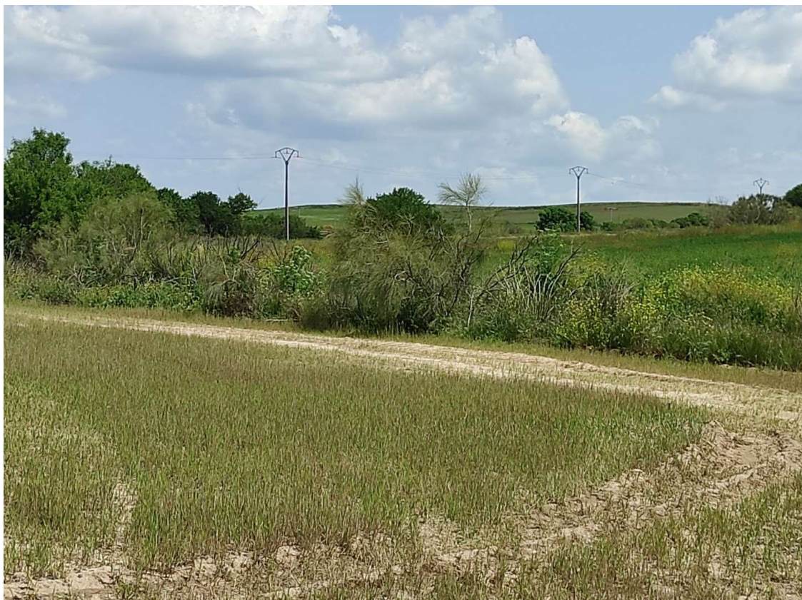
Ubicación del apoyo T-110