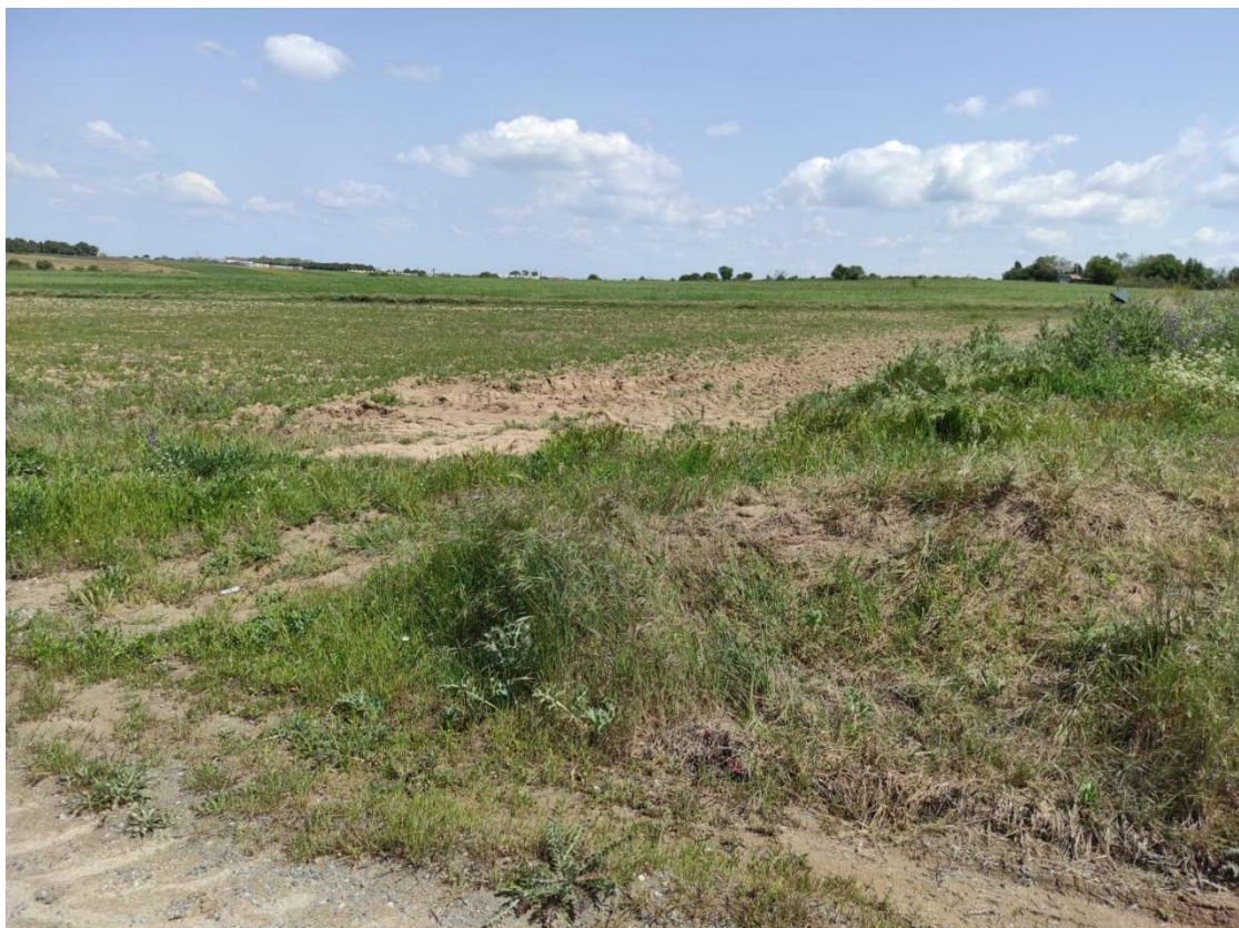
Ubicación del apoyo T-113