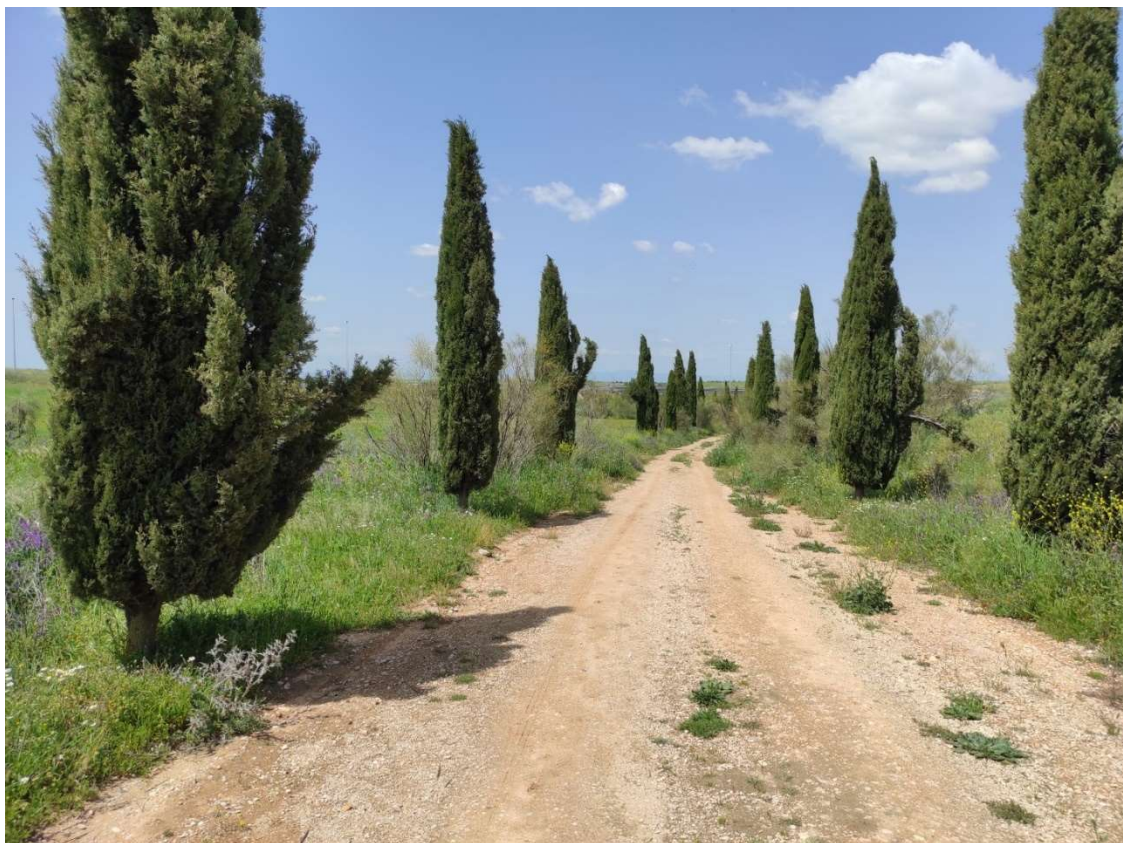
Camino que cruzará la traza soterrada en dirección al apoyo T-107PAS