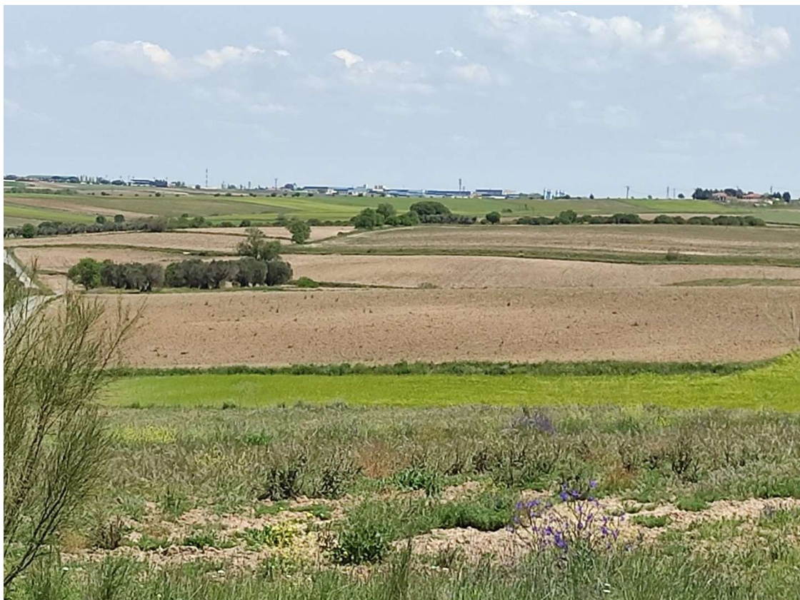
FOTOGRAFÍA 15: ACCESO SUR DE LA PFV DE RECECHO SOLAR JUNTO A M220. LÍNEA DE MEDIA TENSIÓN PARALELA A CAMINO.