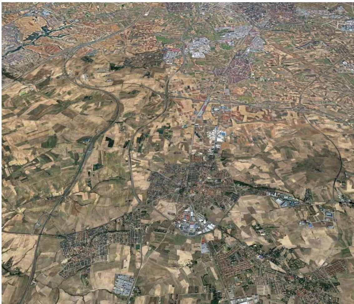
Vista general desde Serranillos del Valle hacia Moraleja de Enmedio.