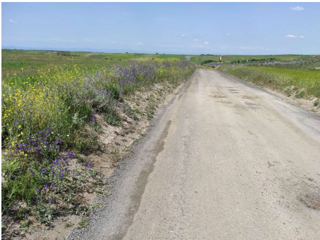
Camino de acceso al apoyo T-108